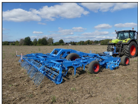
Met de Koralin 9 kun je heel ondiep een stoppелbewerking uitvoeren

stoppелbewerking toonde Lemken de Koralin 9, dit is een ganzenvoet cultivator met vlakke beitels waardoor hij vlak onder het maaiveld de vegetatie afsnijdt. Met deze machine kun met een relatief lichte trekker uit de voeten. Voorwaarde is wel dat het land niet teveel kapot gereden is en dat de structuur nog goed is, dan kun je met een lichte bewerking volstaan. Zo blijft het vocht in de grond terwijl het contact van het vocht met de plant is afgesneden. Tijdens de presentatie leverde de machine goed werk en deed hij wat ons verteld was. Midden voor elke beitel loopt een schijf waardoor de machine niet gaat stropen.