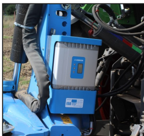
Middels de ISOBus is de ploeg is op de terminal af te stellen

Met name de afzet naar Rusland loopt als een trein. In West-Europa stagneert de afzet van ploegen door de droogte in het derde opeenvolgend jaar. Ook de Oekraïne loopt slechter omdat boeren daar liever land