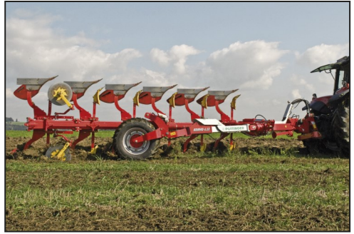
Met de Servo 6.50 heeft Pöttinger een actueel ploegen programma

bij de ploegen is de halfgedragen Servo 6.50 waarbij men de eigenschappen van gedragen en halfgedragen ploegen heeft verenigd. De ploeg is ontwikkeld voor trekkers tot 500 pk en van 6 tot 9-scharen leverbaar. Kenmerkend is het ver naar voren liggend draaipunt waardoor de zijdelingse krachten worden geminimaliseerd. Met Traction Control heeft men een gewichtsoverbrenging van de ploeg op de achterwielen van de trekker voor een optimale bodemaanpassing om slip te reduceren. Het assortiment