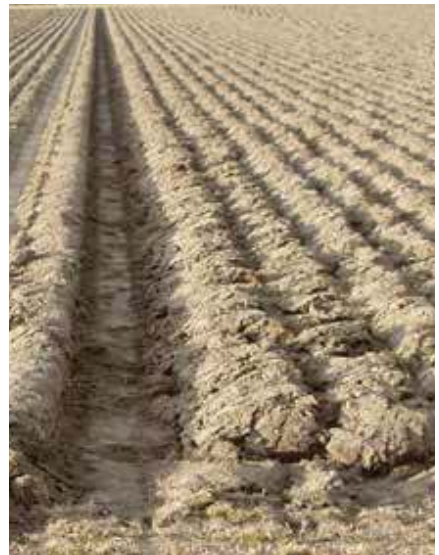
De eindvoor Wentel