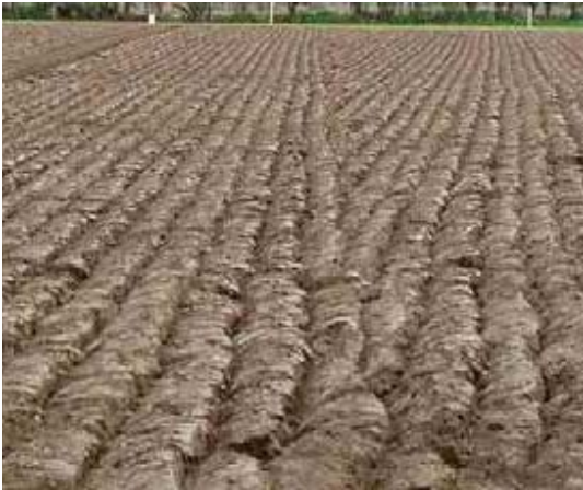
De geer - wentel