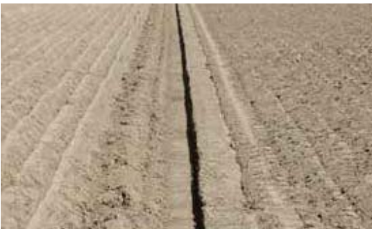
De eindvoor Rondgaand