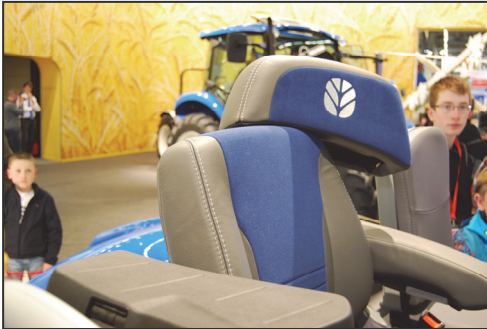
Wegklapbaar deel van de rugleuning

hebben een eigen ontwerp fronthead, ABS zowel op de trekker als op de aanhangwagenberemming. Op de SIMA stond de T7.225 en met Isobus3 kan de trekker vice-versa met de machine communiceren. In de cabine heeft de trekker een nieuwe comfortzitting met verwar-