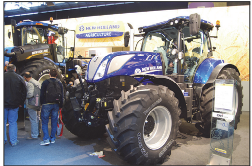
T7.225 op de SIMA

tot 1991 toen de Italiaanse FIAT-groep een meerderheid van 80% verwierf in New Holland en Ford en Fiat werden geïntegreerd tot New Holland. De laatste stap was in 1999 toen ook Case-IH (Case Corporation) de familie kwam versterken tot CNH Global dat nu met Fiat Industrial is samengevoegd tot